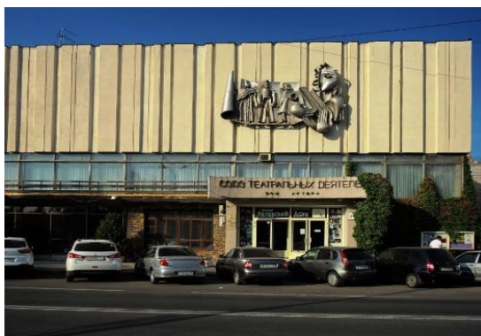
Дом Актёра имени М.Г. Лазарева