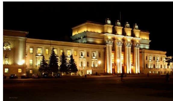
Самарский академический театр оперы и балета