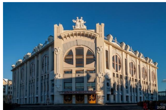
Самарская Государственная Филармония